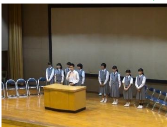
新生徒会からの挨拶

新しい生徒会がスタートしました。役員の皆さんの役割を紹介します。皆で協力していきましょう。